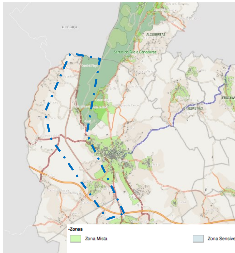
FIGURA Nº II

No caso do Município Rio Maior o Zonamento Acústico foi estabelecido no âmbito de desenvolvimento dos Mapas de Ruído do Concelho, de acordo com planta apresentada abaixo.